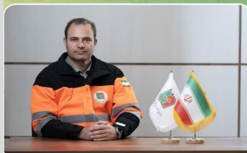
◆ پیام تبریک ◆◆◆◆

انجمن صنفی مهندسان راه و راه آهن استان خراسان جنوبی