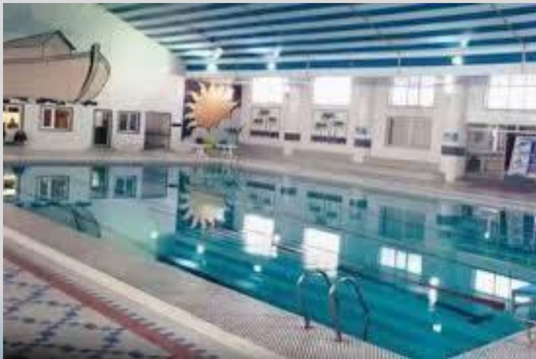
بلیط رایگان استخر کوثر

* پیگیری استفاده از تسهیلات و تخفیفات بر اساس مفاد تفاهم نامه های فیما بین * پیگیری استفاده از ظرفیت سالن های ورزشی به نفع اعضای انجمن