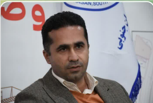
◆ پیام تبریک ◆◆◆◆