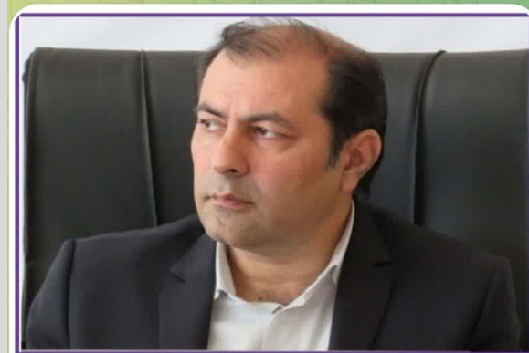
◆ پیام تبریک ◆◆◆◆

انجمن صنفی مهندسان راه و راه آهن استان خراسان جنوبی